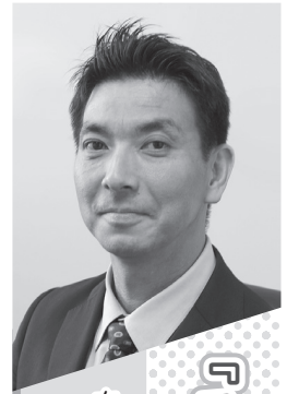
奈良県立医科大学 疫学・予防医学講座 教授 佐伯 圭吾